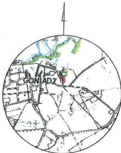
SZKIC ORIENTACJI SKALA 1:10000

ZAKŁAD USŁUG GEODEZYJNO KARTOGRAFICZNYCH „POMIAR” E.J. ANDRAKA ul. Kolejowa 2, 19-100 Mońki NIP 546-133-70-88 tel. 506 155 321, 506 155 093 pomiar.geodezja@gmail.com